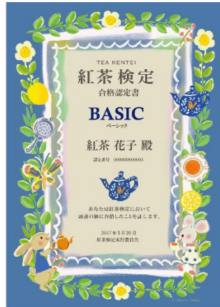
「カレルチャペック紅茶店」特製 限定イラスト入り合格認定証（イメージ）