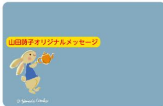
「カレルチャペック紅茶店」特製 限定イラスト入り合格認定カード（イメージ）