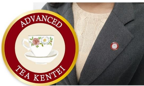
合格認定バッジ アドバンス (イメージ)